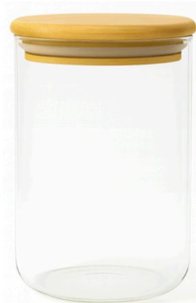
POTE DE VIDRO REDONDO VGHOME TAMPA DE BAMBU 1000ML

SKU: 18120-3S0J100-2BL EAN: 7898996390556 DUN: 17898996390553