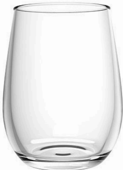
COPO OVAL DE VIDRO VGHOME 500ML

SKU: 24174-495 EAN: 7898974939135 DUN: 17898974939132