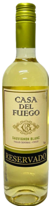
VINHO FINO SECO CASA DEL FUEGO RESERVADO SAUVIGNON BLANC 750ML (CHILE)

SKU: 23089 EAN: 7809625209767 DUN: 17809625209764