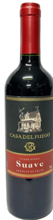
VINHO FINO SUAVE CASA DEL FUEGO RED BLEND 750ML (CHILE)