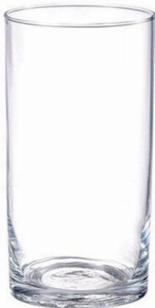
COPO ALTO DE VIDRO VGHOME 350ML

SKU: 24174-494 EAN: 7898974939128 DUN: 17898974939125