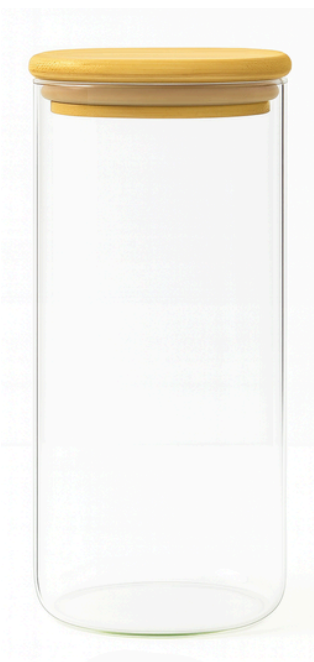
POTE DE VIDRO REDONDO VGHOME TAMPA DE BAMBU 1500ML

SKU: 18120-3C0J100-2BL EAN: 7898996390587 DUN: 17898996390584